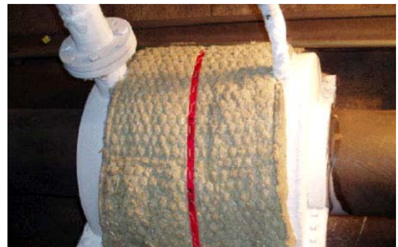
Rohrfrostung Stahlrohrleitung DN 300